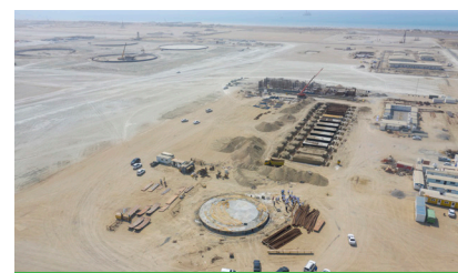
نیروگاه تأمین برق