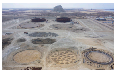
نمایی از مخازن ذخیره سازی نفت خام

درصد پیشرفت احداث نیروگاه تأمین برق با ظرفیت ۱۴ مگاوات